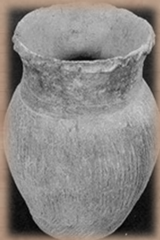
เครื่องปั้นดินเผายุคหินใหม่ พบในประเทศจีน