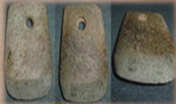
ขวานหินขัดก่อนใส่ด้าม