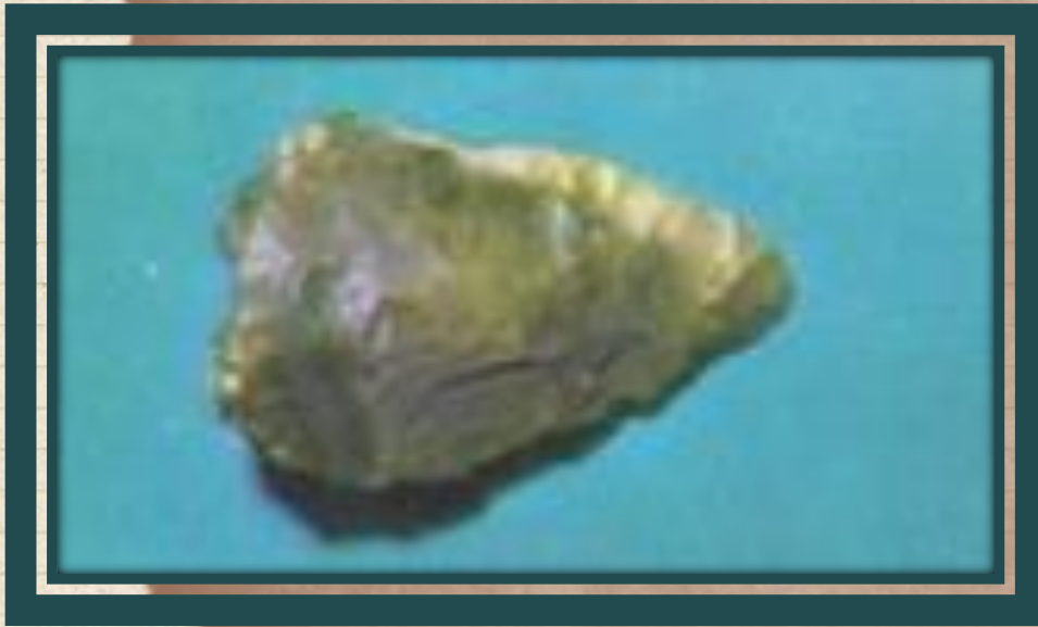
ตัวอย่างเครื่องมือหินกะเทาะ แบบ อาชลี้น ( Acheulean ) ในยุคหินเก่าตอนต้น