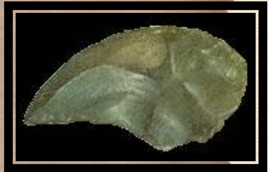
เครื่องมือหินกะเทาะ แบบมูสต์เตเรียน ( Mousterian ) ในยุคหินเก่าตอนกลาง